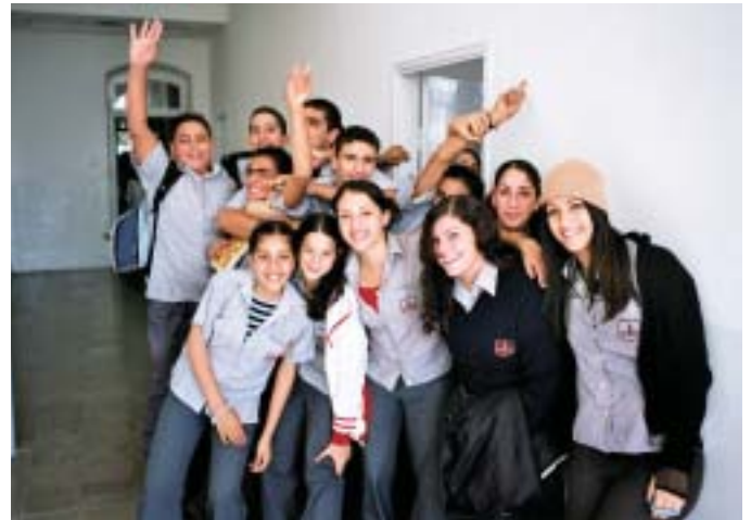
Happy Faces at FBS