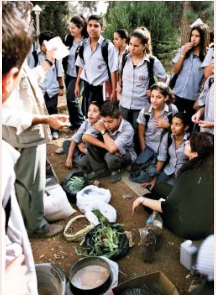
RFS Students at Kaykab Educational Garden