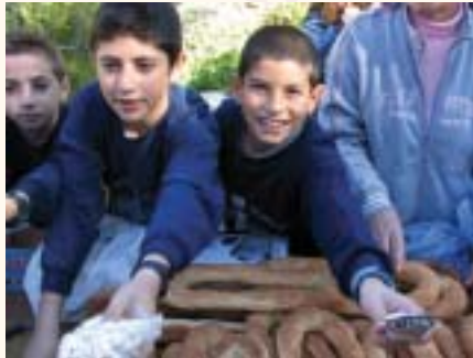
Children at Elementary school selling food for white gifts

يقوم طلاب الصفوف الابتدائية بزيارات ميدانية لمؤسسات عدة في مدينتي