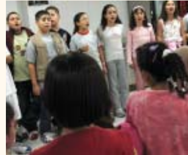
Elementary students singing for children at Inaash Al Usra

● زيارة لفتيات إنعاش الأسرة، وتقديم وجبة إفطار إذ صادفت الزيارة خلال