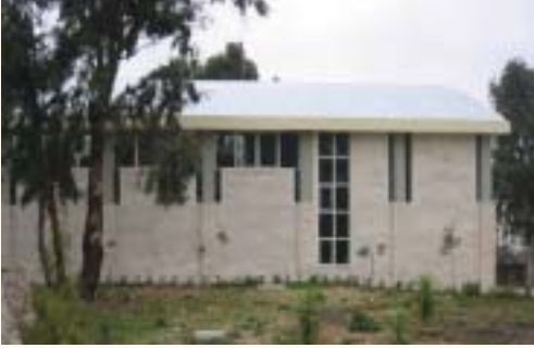
FBS - Multi Purpose Hall