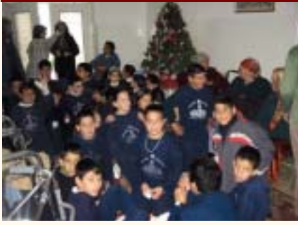
FGS Students at the old people's home

نقدم امتناننا لجميع الطلاب والأهالي الذين يساهمون بالتبرع، أو يرافقون الطلاب والمعلمات بالزيارات ونشمن دور المعلمات ولا سيما منسقة البرنامج المعلمة لنا حمودة.